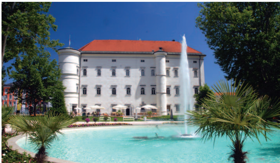
Tagungsort Schloss Porcia, Spittal an der Drau