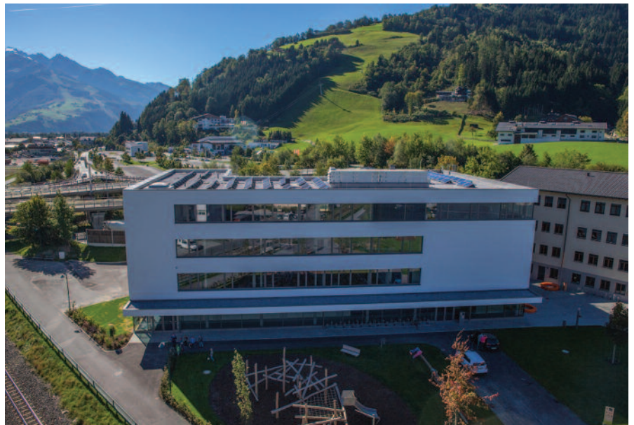
Schulzentrum Schüttdorf in Zell am See: Budgetschonend finanziert und für seine ökologische Bauweise für den Staatspreis für Architektur und Nachhaltigkeit nominiert.

Für seine Gesamtkonzeption wurde der Schul-Neubau für den