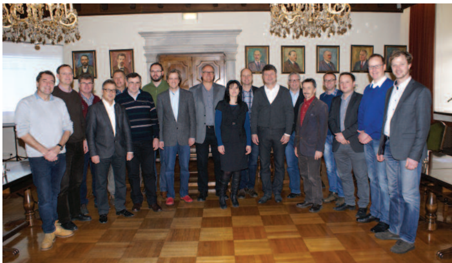
Teilnehmer der Bezirkstagung